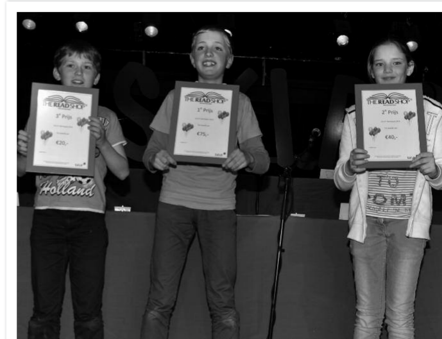
'De drie prijswinnaars van de kennisquiz.'

Tussen de vele vragen door waren er leuke spelletjes die ook punten opleverden. De kinderen moesten een zo hoog mogelijke toren maken van marshmallows met spaghetti-stokjes. Of... vanaf het podium druiven in een emmer uitspugen. Tijdens de laatste ronde "Princenhage" bleek dat de scholen nog aandacht mogen besteden aan het Aogse volkslied.