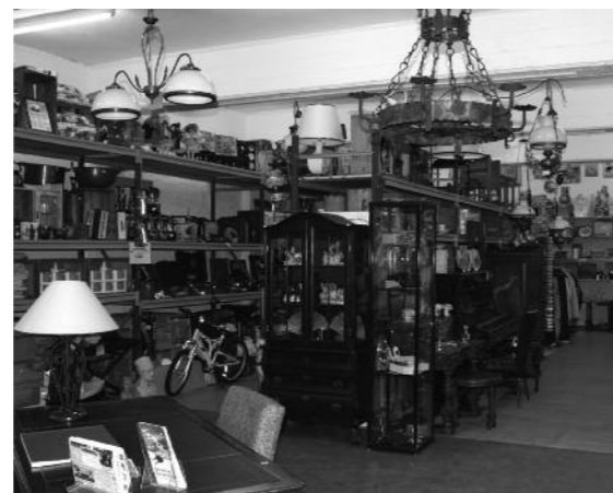
Bezoek ook eens onze markt in tweedehandsgoederen.

Ook voor de inkoop/verkoop van tweedehandsgoederen moet u bij A&R Handelsonderneming zijn!