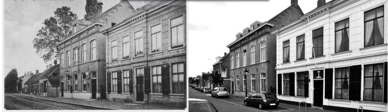
Dreef met postkantoor, Princenhage

Zoals u vorige week al hebt kunnen zien, zijn we begonnen met een nieuwe fotoreeks: Princenhage Toen & Nu, waarin we oude foto's vergelijken met hoe het er nu uitziet.