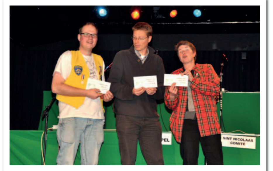
De prijswinnaars van de Dorpskwis

De voorrondes werden het best gedaan door Bende Benukt, VV Groen-Wit, CV Simpel, CV de Schutters, de Zuilenschuivers blauw, Maggik, de Zuilenschuivers geel en het Sint