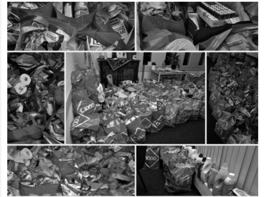
Foto: een onvoorstelbare hoeveelheid levensmiddelen werd geschonken