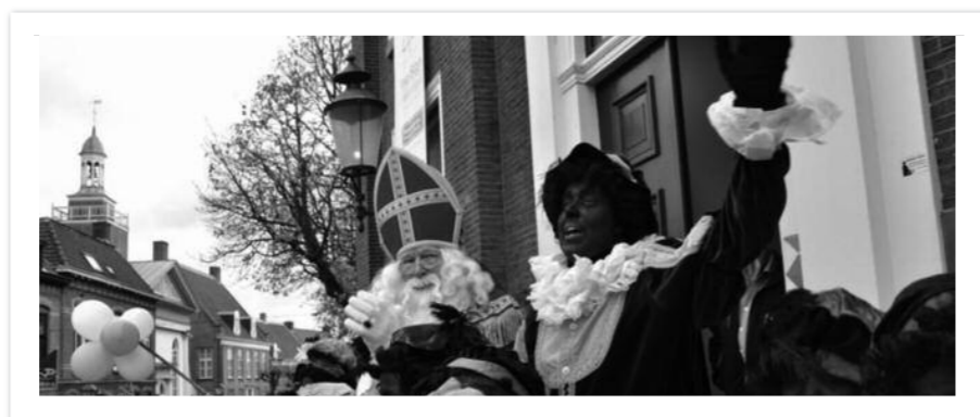
Sinterklaas was duidelijk blij dat hij weer in Princenhage was.

Ook dit jaar sloeg Sinterklaas Princenhage niet over. Rond half 2 kwam hij op zondagmiddag 24 maart de Haagsemarkt op met zijn véle, véle Pieten. Sinterklaas nam ruimschoots de tijd voor alle kinderen. Er was echter wel een probleempje dit jaar. De Pieten TomTom en Toeter wisten niet meer wie ze waren. Ze dachten dat ze de Haagsemarkt moesten poetsen en dat ze Roy en Sjan waren. Gelukkig kwam het ook weer goed met ze. Het moet gezegd. Het Sint Nicolaas-comité had geweldig voorbereidend werk verricht en Maarten van de Rijt kletste het geheel perfect aan elkaar. Wat is het ook mooi om te zien hoe de leden van alle Princenhaagse kapellen een geweldig orkest vormen. Na de intocht op de