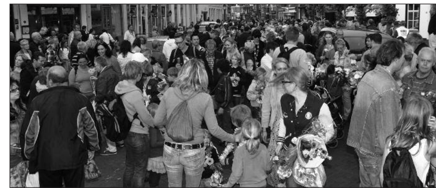
Het was een drukte van jewelste op de Haagsemarkt tijdens de intocht op vrijdag.