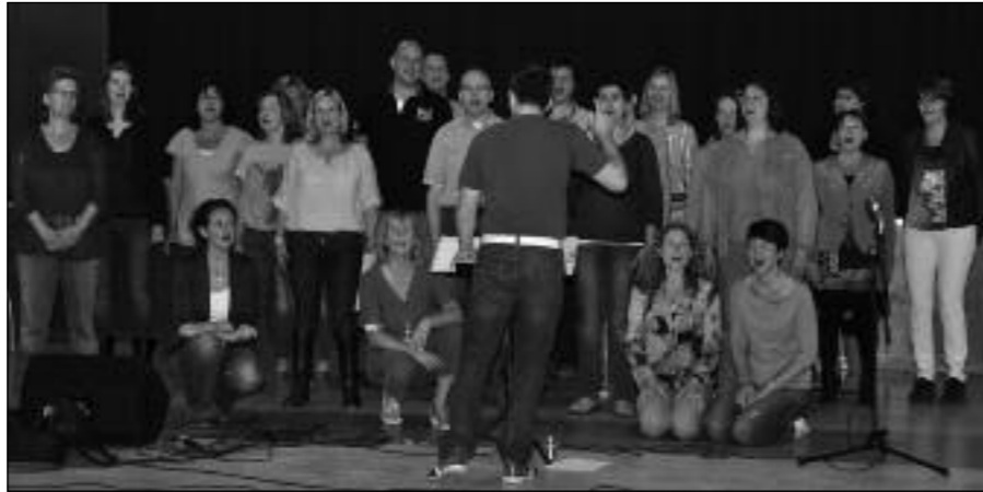
Popkoor Njoy druk aan het repeteren om de laatste puntjes op de -i te zetten.

Op zaterdag 1 juni treedt Njoy op in de Para, van Coothplein 39 Breda. Toen ik de repetitie bezocht, was me al meteen duidelijk dat er op alle fronten hard gewerkt wordt om een zo goed mogelijk optreden weg te zetten. Er werd veel gewerkt met choreografie en de solisten waren in de vergaderzaal met een zangcoach aan de slag. Voor dit jubileumconcert is er een groot aantal nieuwe nummers ingestudeerd. Ook aan de opbouw van het concert is zorgvuldig aandacht besteed: "Het concert zit zo in elkaar dat je langzaam wordt meegenomen, eindigend in een echte party".