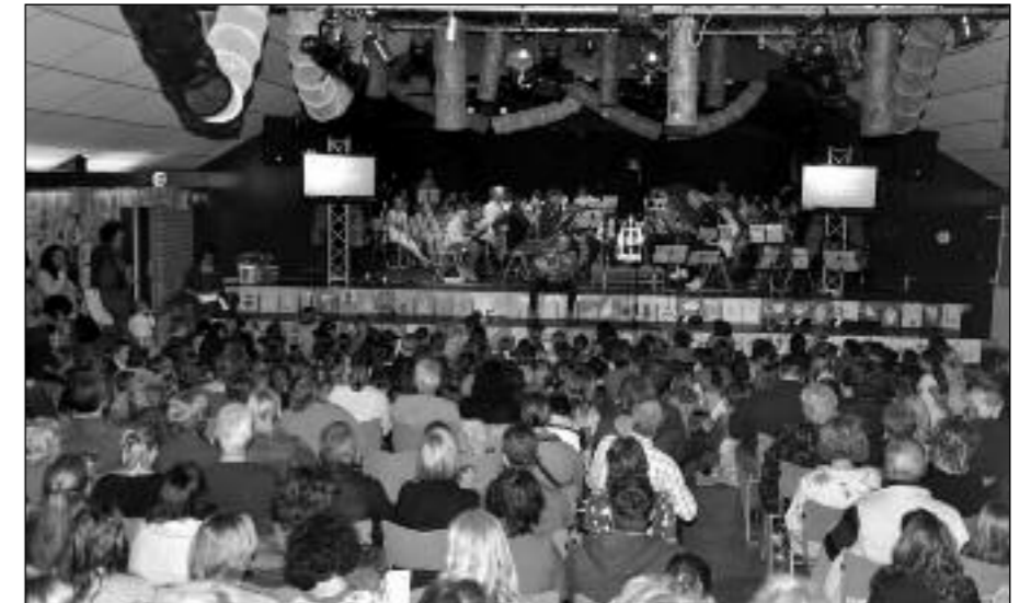
Volle bak in de Rabozaal bij de afsluiting van het scholenproject

Na afloop kregen de kinderen de gelegenheid om in de Vlaamse Schuur alle instrumenten uit te proberen. Toen bleek maar weer wat het populairste instrument is..... Het drumstel.