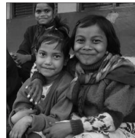
Meisjes in Mirpur.

Dat geld willen wij nu bij elkaar zien te brengen, opdat ook de meisjes van het kosthuis in Mirpur de kans krijgen op een betere toekomst.