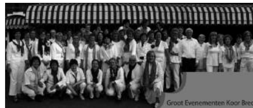
Groot Evenementen Koor Breda

Op 30 januari 2007, kwamen drie enthousiaste mensen bij elkaar en zag het Groot Evenementen Koor Breda, afgekort GEK Beda, het levenslicht.