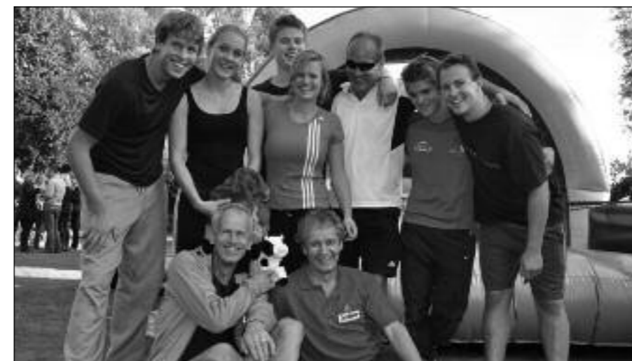
Het team van de familie Voeten wint de weilandgames

Het SGAP organiseert geweldige activiteiten in Princenhage. Stichting CC 't Aogje óók. Als je die twee combineert, heb je écht iets leuks. Zes jaar geleden besloot men om samen de Weilandgames te organiseren, een wedstrijd tussen diverse clubs uit Princenhage.