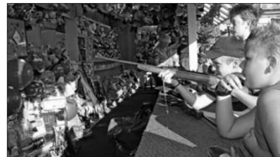
En .... natuurlijk een schietsalon

Op het moment dat u dit leest zijn de kermisexploitanten al dagen bezig om hun attracties op te bouwen. De kermis duurt van zaterdag 6 oktober 13.00 uur tot en met dinsdag 9 oktober 23.00 uur. Wat kunt u zoal kunt verwachten op de kermis? Op het kruispunt Esserstraat/Haagweg staan de wip, de autoscooter, glazen doolhof, bussenspel en kunnen de kinderen ponyrijden. Op de Haagsemarkt onder andere de nougatsuikerkraam, een suikerspin/popcornkraam, grijpautomaten, een lijntrekspel, minicars, draaimolen, eendenspel, skeepal, aquablasta, pusher, breakdance, een schietsalon en natuurlijk een snack- en gebakswagen.