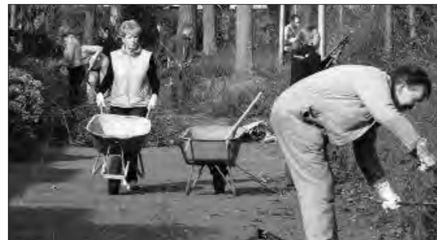
Snoeien in de Steenhouwerstraat in maart 2012

U kunt zich opgeven door te mailen naar PrincenhageGroen@gmail.com of bel- len: 076-5146945 (Marie-Louise de Ponti). Ook als u geen interesse hebt om te snoeien, maar toch wilt helpen die dag, dan bent u van harte welkom en horen we dit graag! We hopen op een grote opkomst en een fijne werkdag.