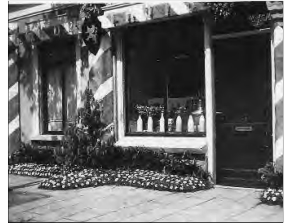
Winkel aan de Dreef 101-103