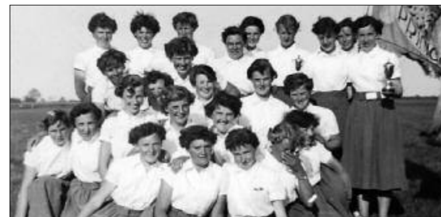
De sportclub van de Princenhaagse jonge Boerinnen behaalde in 1959 op een interkring sportdag in Uden al eerste prijzen.