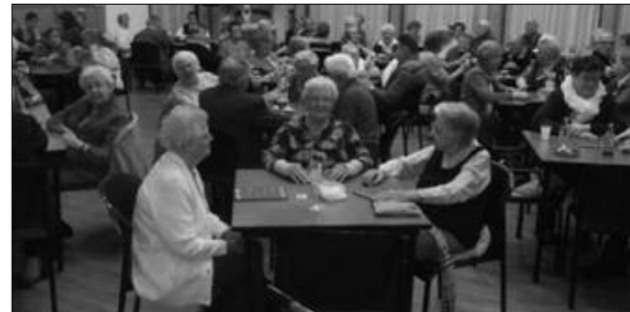
Op de foto Bingo bij de KBO in de Haagse Beemden

Na de koffie en de lunch zal een blinde troubadour moderne, maar ook wat oudere liedjes ten gehore brengen, waarna van 15.30 tot 17.30 uur de receptie volgt, met daarbij een warm en koud buffet.