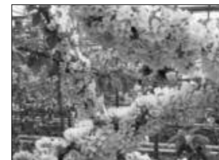
Foto van de kersenkwekerij De Lieshof

Het is inmiddels een jaarlijkse traditie om een opendag te organiseren op 2e pinksterdag (28 mei) bij de deelnemers van 'Beleef de Rith'. Het blijft ons doel om iedereen die geïnteresseerd is, de gelegenheid te geven om eens binnen te kijken bij de bedrijven en zo beter bekend te worden met de agrarische producten.