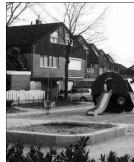
Op de foto Minnemansaker/Kesselloop in 2009

Een overleg vindt ongeveer eens in de twee maanden plaats. Daarnaast hebben zij tussentijds ook contact met de sleutelpersonen binnen de organisaties wanneer dit nodig is.