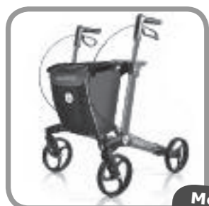
De Gemino rollator

Deze lichtgewicht design rollator is verkrijgbaar in diverse trendy kleuren met bijpassende manden. Nu met gratis stokhouder t.w.v. € 29,- en gratis tas in bijpassende kleur t.w.v. € 59,95.