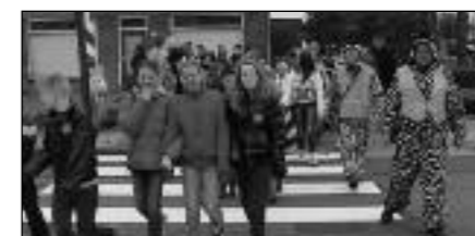
Zebra-oversteek in de Molenstraat in Zundert. Let op de twee benige zebra's.