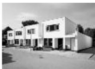
De Neel Oost, Prinsenbeek

Grenssteen 27 - 4815 PP Breda - 076-541 55 97 www.bouwbedrijfboot.nl