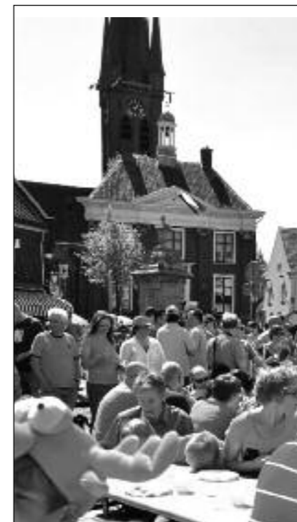
gezellig druk op de Haagsemarkt tijdens het poffertjes eten.

De nazit vond plaats op de Haagsemarkt met de verloting van de taarten voor de mensen die hadden gevraagd en voor het overige héél veel gezelligheid en kletsen