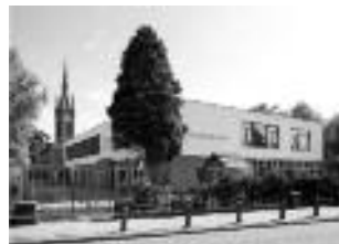
BS Sinte Maerte, Breda

Bouwen is in onze visie méér dan construeren. Bouwen is ook gevoel hebben voor materialen en oog hebben voor detail. Betrokken zijn bij opdrachtgevers, wensen begrijpen en vertalen naar de praktijk. Werken met respect voor natuur en milieu en streven naar de hoogst haalbare kwaliteit. Bouwen is een ambacht dat niet alleen vakkennis vereist, maar zeker ook bezieling.