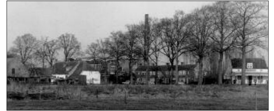
Zicht op de Mastbosstraat vanuit de Rithsestraat. Links Melkinrichting Sint- Martinus en rechts café de Roskam. Foto omstreeks 1965