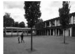
BS Eerste Rith, Breda