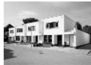
De Neel Oost, Prinsenbeek

Grenssteen 27 - 4815 PP Breda - 076-541 55 97 www.bouwbedrijfboot.nl