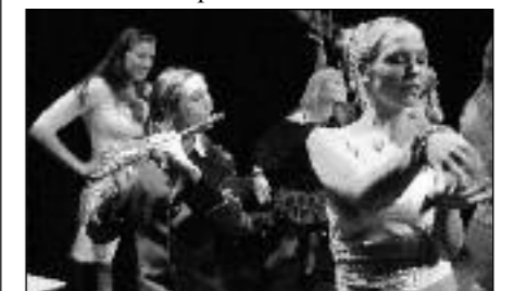
Girlpower tijdens de KAM.

De KAM wordt georganiseerd door een bestuur van zeven personen met hulp van zo'n twintig vrijwilligers. Maar de KAM wordt uiteindelijk gemaakt door alle deelnemers samen. Verenigingen, wel of niet gesubsidieerd, kunnen zich inschrijven tot uiterlijk 1 mei aanstaande. Het inschrijfformulier en de bijbehorende KAM-brochure staan op de website www.kambreda.nl Het programma voor de 30ste KAM wordt op vrijdagavond 15 juni met de deelnemers besproken.