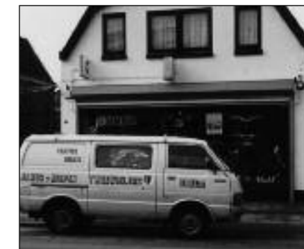
"Ben even weg"