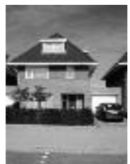
De Neel Oost, Prinsenbeek