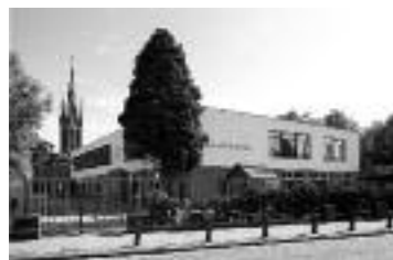
BS Sinte Maerte, Breda

Bouwen is in onze visie méér dan construeren. Bouwen is ook gevoel hebben voor materialen en oog hebben voor detail. Betrokken zijn bij opdrachtgevers, wensen begrijpen en vertalen naar de praktijk. Werken met respect voor natuur en milieu en streven naar de hoogst haalbare kwaliteit. Bouwen is een ambacht dat niet alleen vakkennis vereist, maar zeker ook bezieling.