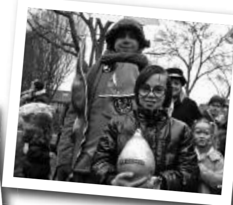
De eerste druppel werd gelukkig weer gevonden.

Na krap twee uurtjes was het daar al zo druk dat de poorten noodgedwongen dicht moesten. Wat een feest werd het weer! 's Avonds was er het limonadebal voor de wat kleineren en in de Pitstop konden de tieners genieten van het disco-carnaval. Ook dit werd voor het eerst in de Pitstop gehouden. Daarbij is een compliment voor de werkgroep disco-carnaval zeker op zijn plaats: de entourage was perfect!. In de Koe werd 's avonds natuurlijk ook vrolijk doorgefeest met vele bands. Ook hier weer een topsfeertje.