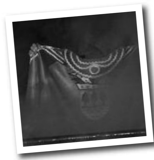
Na drie jaar trouwe dienst gaat Sanseverius in rook op

De laatste daad van Prins Sanseverius voordat hij in rook opging, was het bekendmaken van het nieuwe motto 2013. Dat werd: “Ut stoad'in de sterre”.