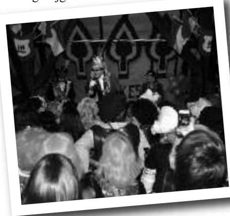
Volle bak op het eerste Vrouwkesbal

Voor de eerste keer in de Aogse geschiedenis is er (naar Biks voorbeeld) een vrouwkesbal georganiseerd in de Koe. De organisatoren hoopten natuurlijk op een goede opkomst en een stevig feest. Ik kon het niet nalaten om even binnen te wippen. De vreemde blikken ontwikkend lukte het me wat foto's te nemen en wat sfeer te proeven. De hele Vlaamse schuur stond vol met feestende vrouwen, de één nog mooier uitgedost dan de ander. Prins Sanseverius was toevallig net bezig met een verfrissende act. Eindelijk eens helemaal los van het normale protocol play-backte hij een potpourri van nummers die over vrouwen gingen. Daarna ben ik maar snel vertrokken. Eén ding was me in een half uurtje wel duidelijk geworden: het vrouwkesbal was een groot succes, staat nú al op de kaart en gaat zeker een vervolg krijgen.