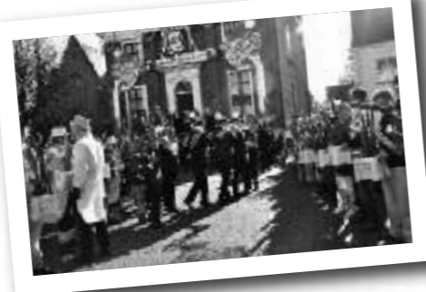
Langs een haag van Sanseveria werd Prins Sanseverius verwelkomd.

's Avonds ging het feest gewoon door met vele bandjes, een bezoek van de Prins etc. Het was nog lang onrustig in de Koe.