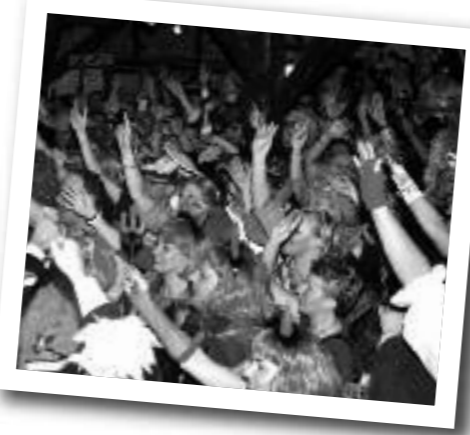
Aogse Bluf wist de Vlaamse Schuur weer helemaal omver te blazen.

's Avonds was er het dorpsbal. In de drie zalen speelden doorlopend bandjes. Alleen de beste bands komen hier terecht en dus was het genieten van Aogse Bluf, Hè-Hè, Black Woows, de Makrele en vele anderen. Wat een geweldig feest is dat Dorpsbal toch eigenlijk. Het hoogtepunt van de avond was een gezamenlijk optreden van Aogse Bluf en de Bielopers in de Vlaamse schuur. De decibellen van band én publiek (wat compleet uit zijn plaat ging) moeten tot ver buiten de grenzen van 't Aogje zijn gehoord.