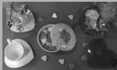
Gevuld met snoep

Haagweg 435, 4813 XD BREDA Tel. (076) 514 33 20, princenhage@readshop.nl