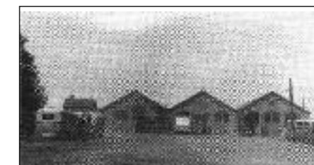
Oude remise begin 20e eeuw