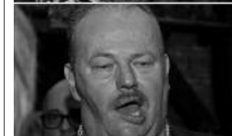
Vocaole Generaole 2011. Deze mensen waren goed ingezongen.