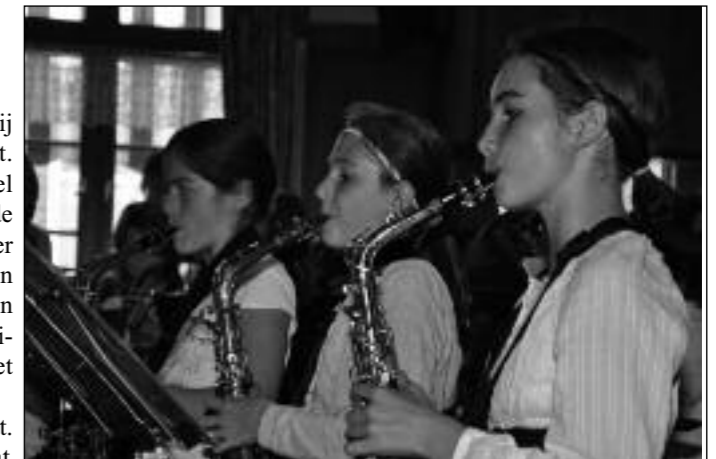
Foto: de jeugd heeft de toekomst bij Cecilia

Zo te horen is de toekomst van Cecilia helemaal veilig gesteld en daar is geen oliebol van gelogen.