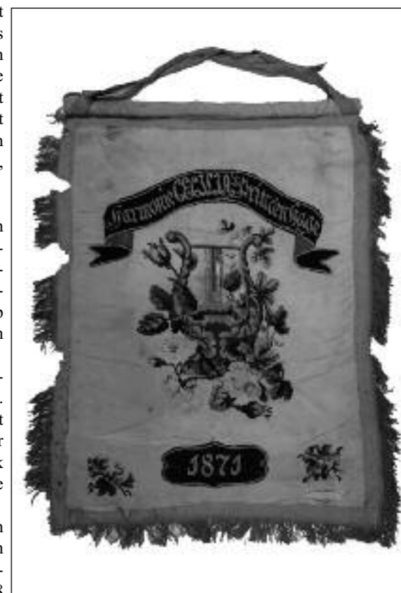
Eerste vaandel van Cecilia uit 1871

Tijdens de expositie zullen leden van Cecilia uitleg geven over hun instrumenten en zullen zij ook spelen. Zaterdag 8 en zondag 9 oktober van 13.00 - 17.00 uur, Haagweg 334bis.