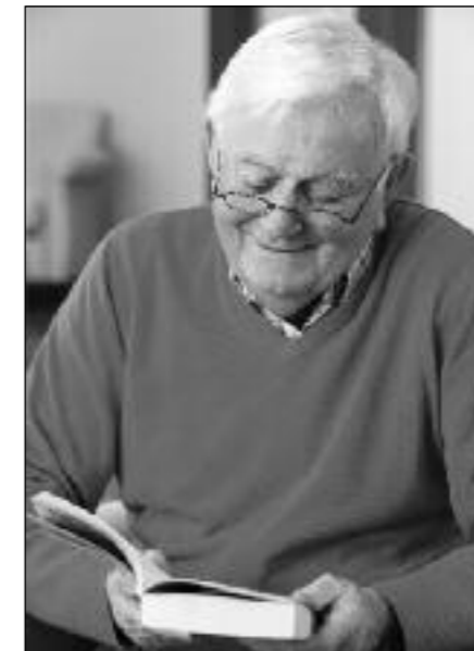
De Bibliotheek aan huis: gemak en plezier

Kijk ook op www.bibliotheekbreda.nl of wij.begintbijjou.nl