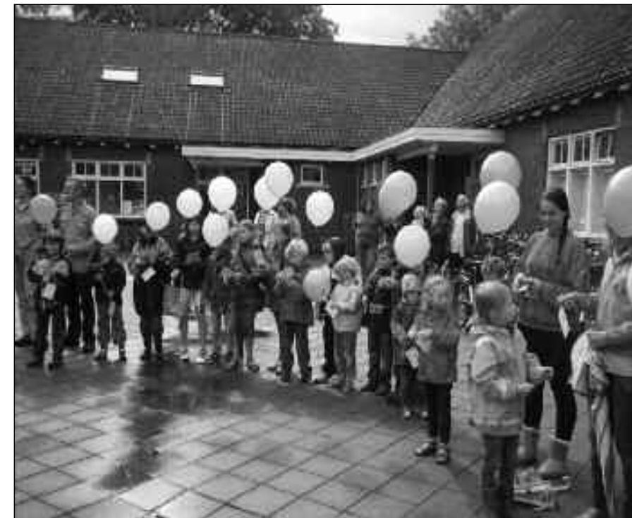
Feestelijke heropening gebouw op 11 juni jl. na grondige verbouwing .....

De geplande commissievergadering ter voorbereiding op de raadsvergadering over dit plan, werd vorige week een week verzet. In de toegestane spreektijd hebben wij geprobeerd duidelijk te maken, dat wij in overleg willen met de gemeente over het behoud van het gebouw. Dit willen we