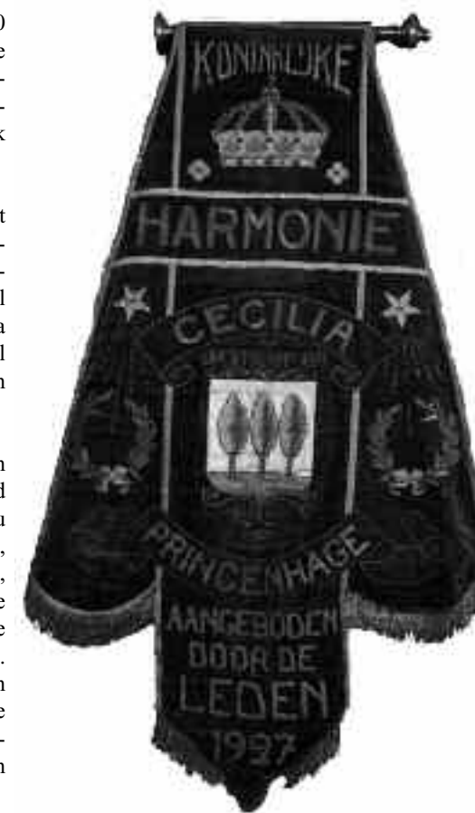
Vaandel uit 1927 aangeboden door de leden

Het heeft lang geduurd voor men bij de Harmonie in een verenigingskostuum uitrukt. De intocht van Sinterklaas in 1953 krijgt de première. In de vijftiger