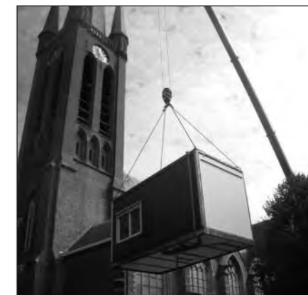
De lokalen bij de kerk worden verwijderd

Het zal u misschien niet ontgaan zijn dat basisschool de Eerste Rith grondig is verbouwd en nieuwbouw heeft gekregen. Nu alle leerlingen na de zomervakantie weer in hetzelfde gebouw passen was het tijdens de zomervakantie tijd om alle noodgebouwen bij de Witwerkerstraat, kerk en