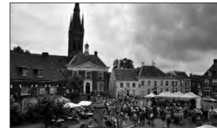
Volle bak op de Haagsemarkt bij het Zomerorkest

Op zaterdag 6 augustus was het gelukkig heel mooi weer. Het Zomerorkest Nederland streek neer op de Haagsemarkt om het publiek te trakteren op een geweldig