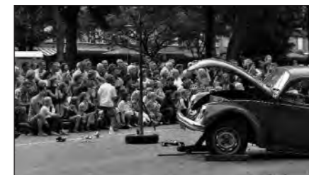
De volwassenen genoten van een voorstelling van Buurman op vakantie.

traal met een zeer vermakelijke muziekvoorstelling. De kinderen konden daarna een workshop knutselen volgen. 's Avonds was het de beurt aan de volwassenen. Zij werden getraakteerd op een knotsgekke voorstelling van "Buurman op vakantie". Voor een uitgebreid (foto)verslag; zie www.taogje.punt.nl