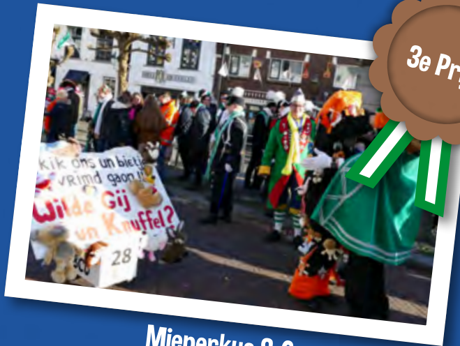
Mieperkus & Co