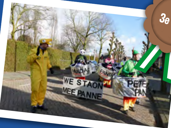
CV. Aogse Hopkes