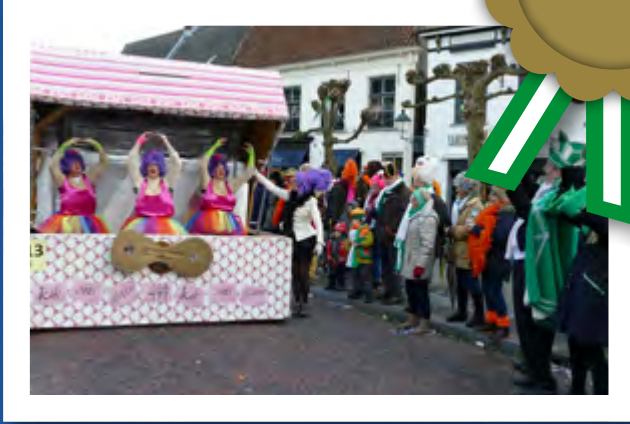
WC.BC.KC.CC.SC. de halve zolen