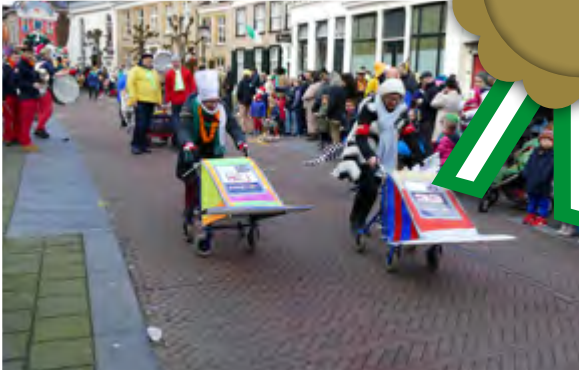
C.V. de Buurmantjes