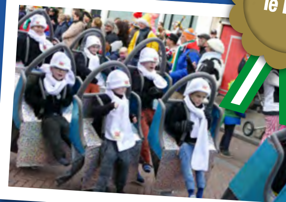
De C.V. de Duuveltjes